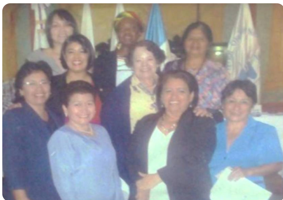
PRIMERA PROMOCIÓN 2013 - DIPLOMADO "DERECHOS HUMANOS DE LAS MUJERES"