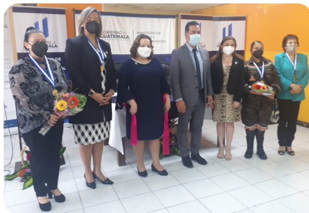
DÍA DE LA MUJER DE LAS AMERICAS 2021