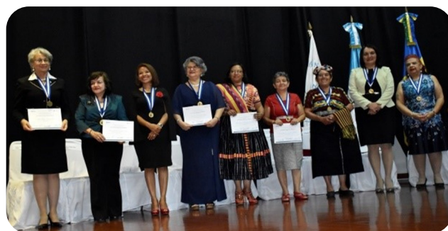
DÍA DE LA MUJER DE LAS AMÉRICAS 2019