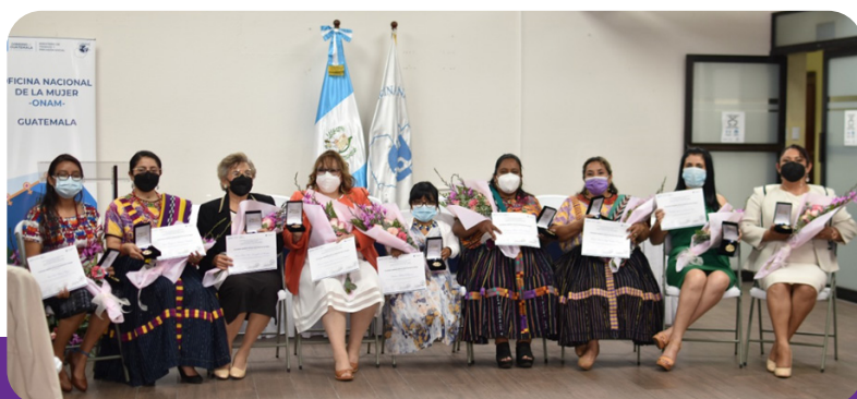
DÍA DE LA MUJER DE LAS AMERICAS 2022