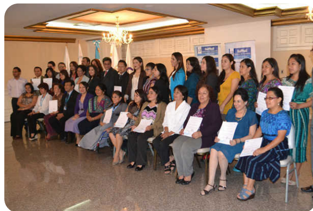
GRUPO COMPLETO DE PARTICIPANTES DIPLOMADO "DERECHOS DE LA MUJER"