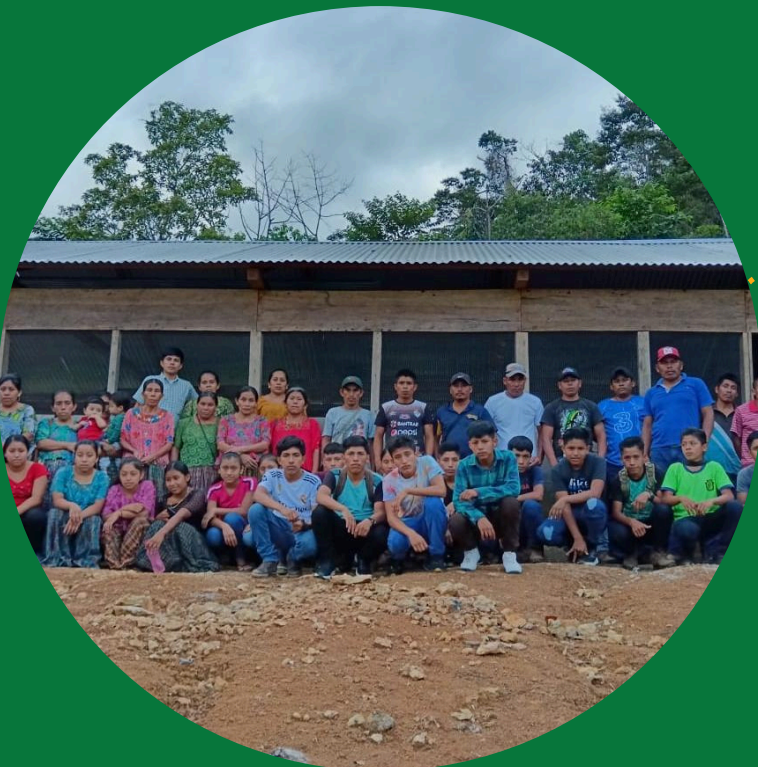
Aldea Satal Cobán