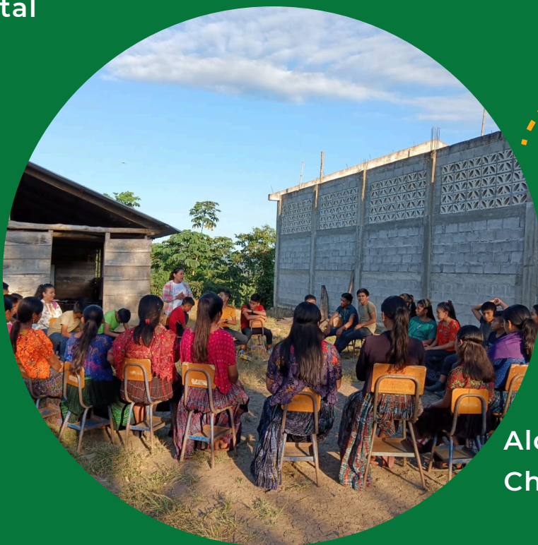
Aldea Xalajá Chivitz Chahal