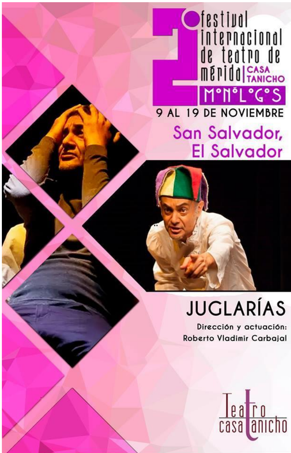
FESTIVAL TEATRO EN MERIDA YUCATAN MEXICO