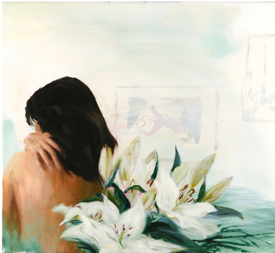
Lilies - 2023