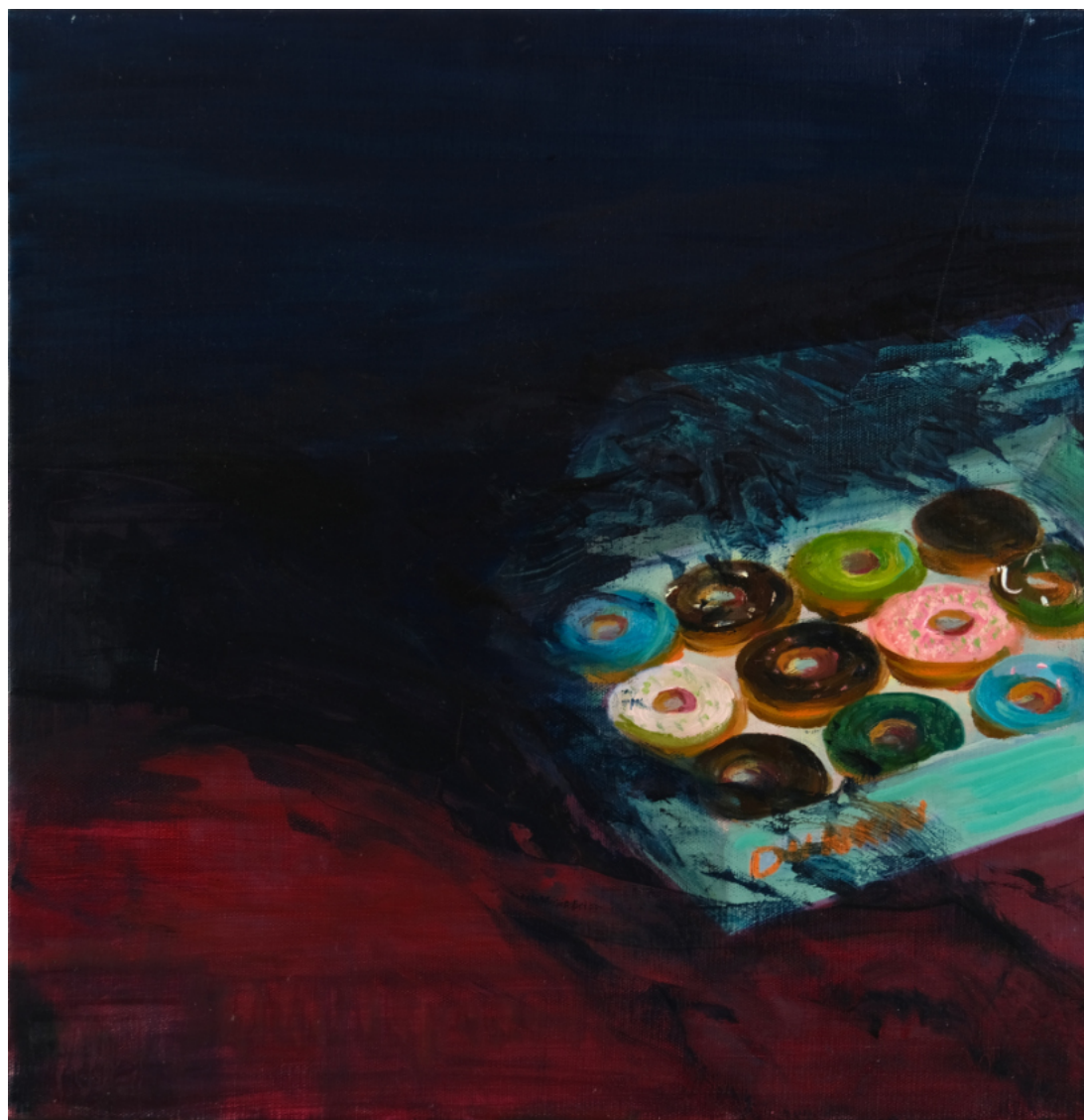
La última caja- 2023