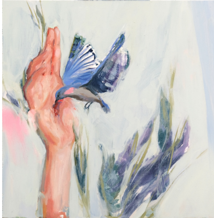
La Llegada - 2023