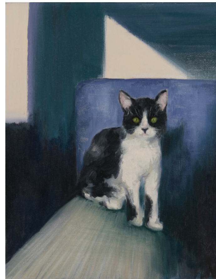
El gato solo tiene cuatro patas - 2023