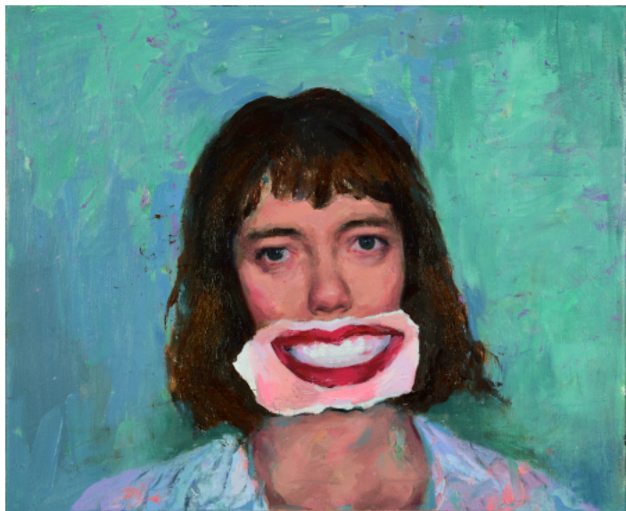
Sonríe - 2021