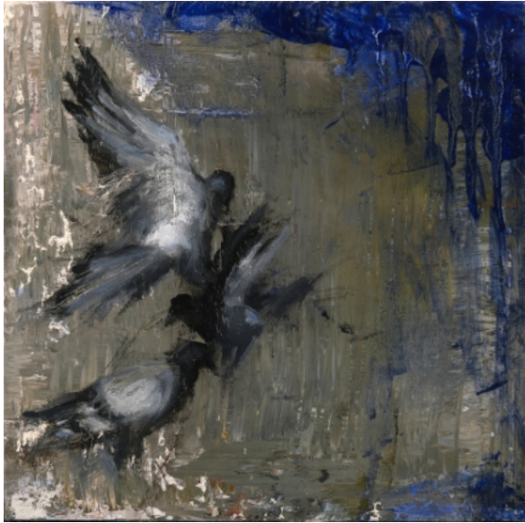
Expectativa - 2021