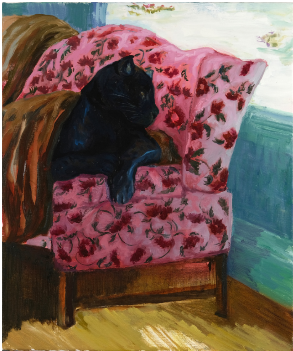
Sin complicar - 2023