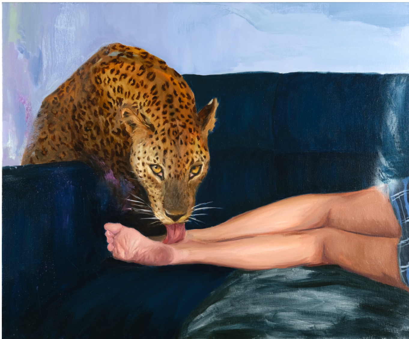
“Por la esquina te presentaste a interrumpir mi benevolencia” - 2023