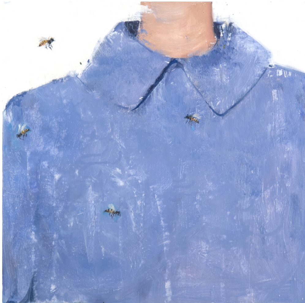
Firme - 2023