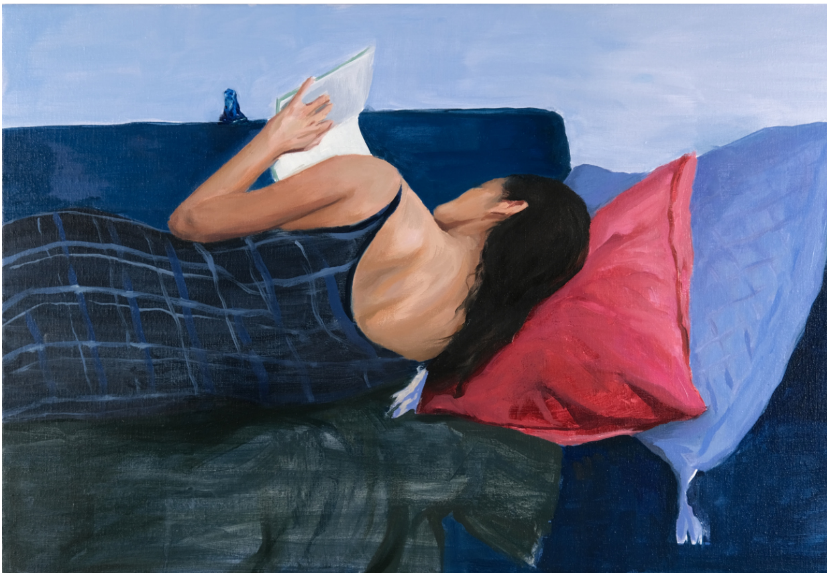
En mi hogar - 2023