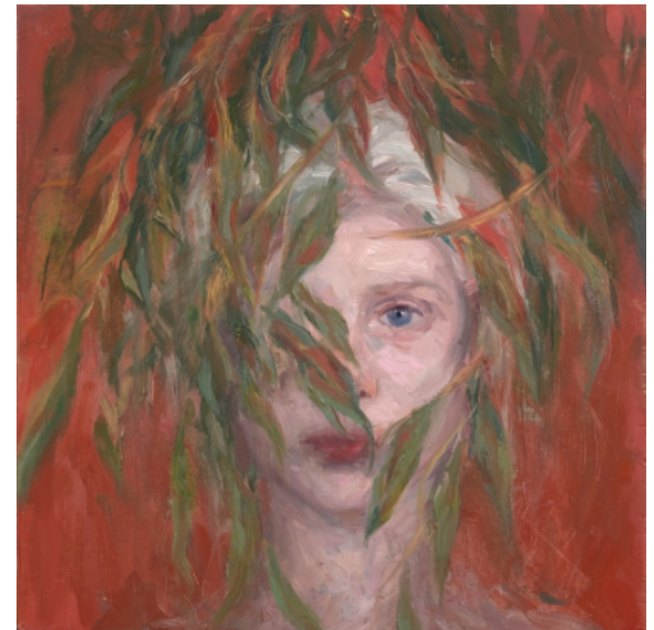
Indómita - 2022