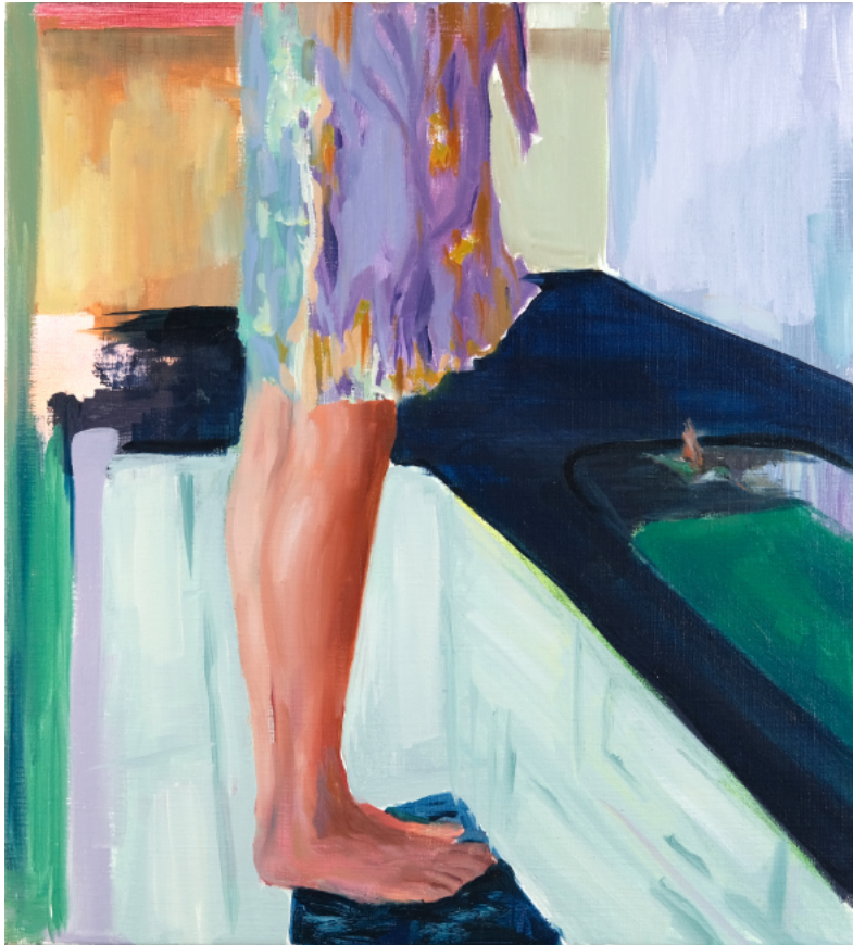
“Aún estabas...” - 2023