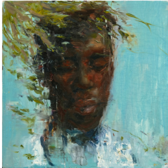
Fuiste, eres. - 2022