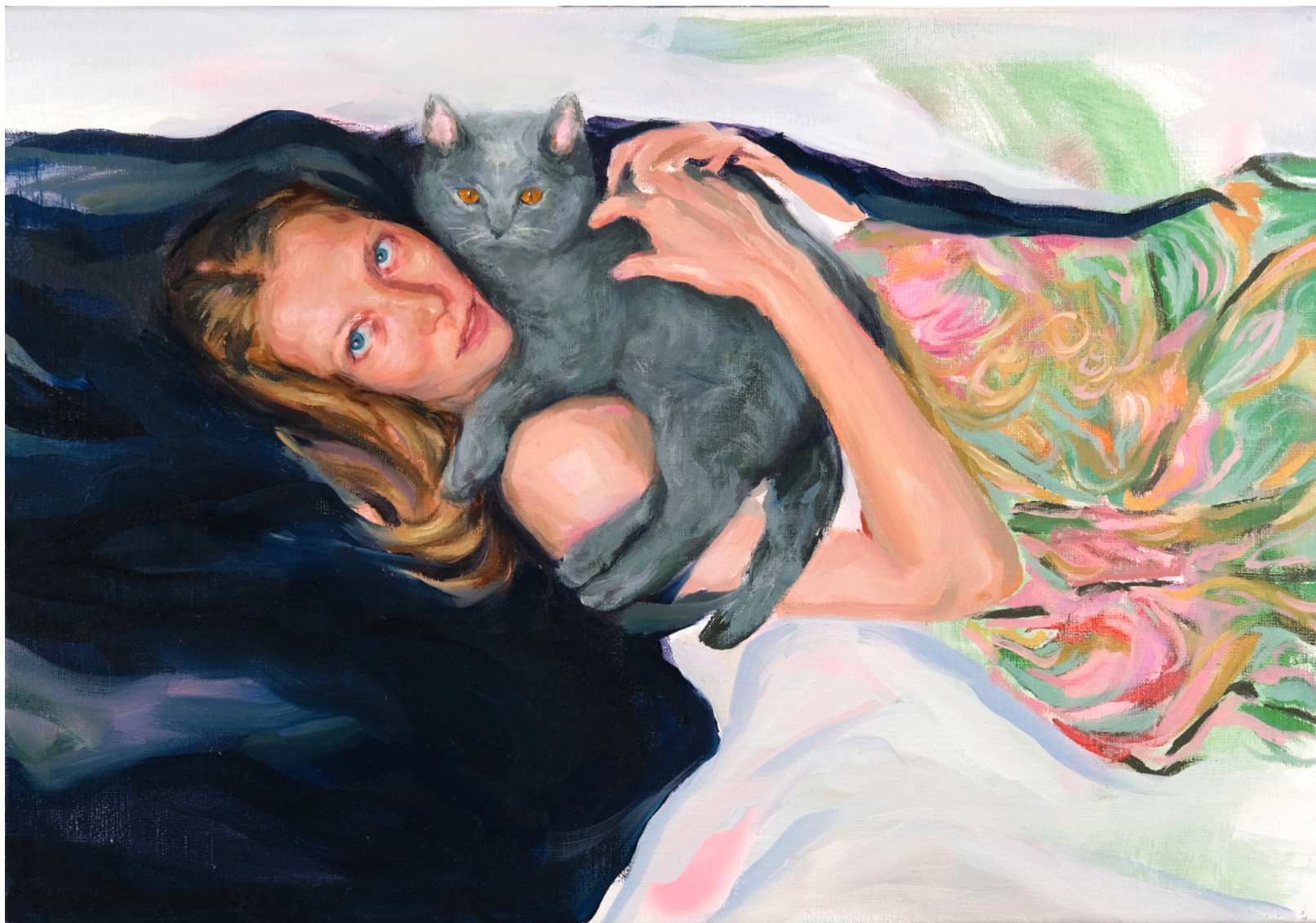
Sustinere - 2023