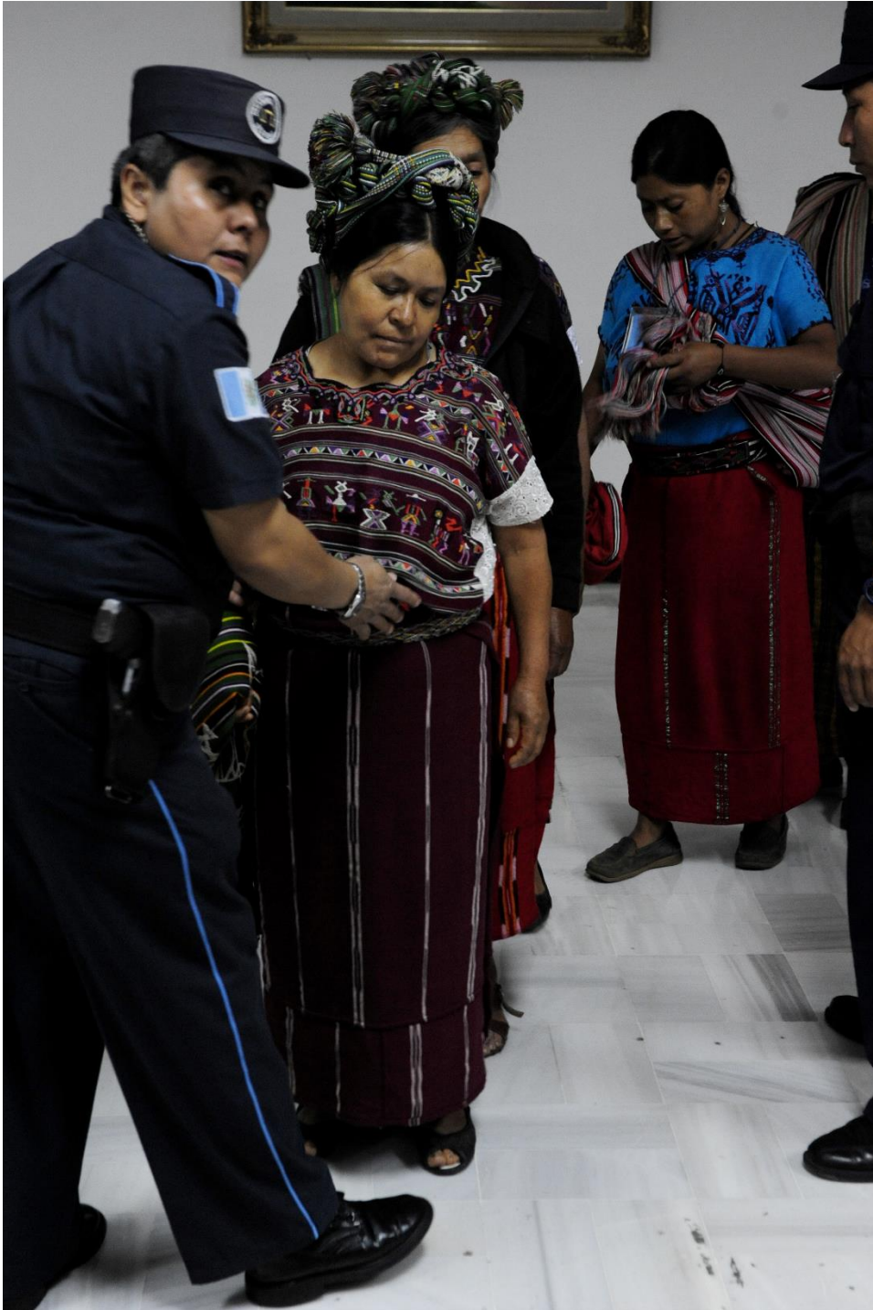
12. Mujeres ixiles sometidas a revisión en la entrada de una audiencia en un Tribunal guatemalteco en donde se juzgaron las violaciones cometidas contra la población ixil por parte del Ejército de Guatemala en los años 80. Mayo 2013

12. Ixil etniako emakumeak erregistratzen ari dituzte Guatemalako auzitegi baten entzunaldira sartzeko; bertan, Guatemalako armadak 80ko amarkadan Ixil herriaren aurka egindako bortxaketak epaitu ziren. 2013ko maiatza.