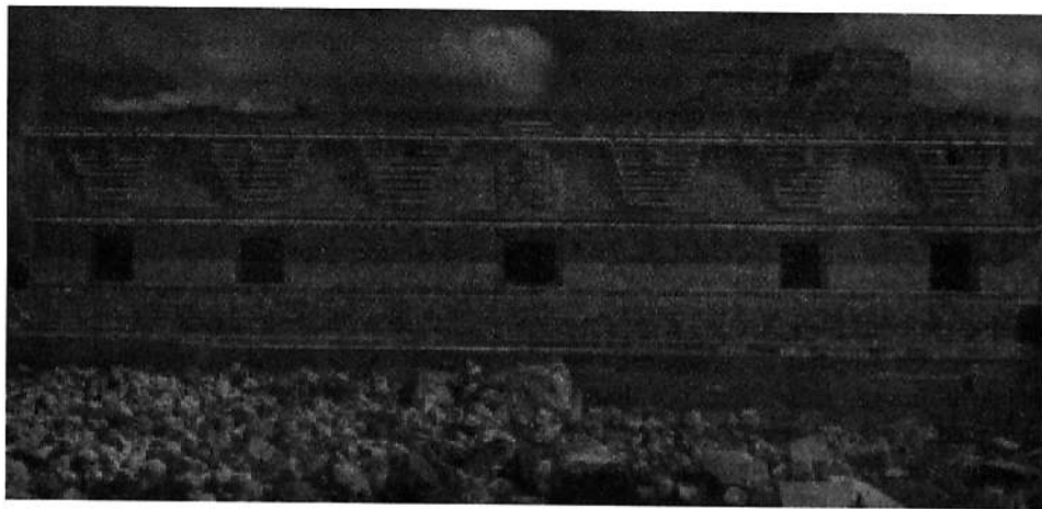
En esta imagen de la Estructura palaciega llamada popularmente Monjas, que se encuentra e el sitio arqueológico de Uxmal podemos aproximarnos a observar como es el estado de conservación de los edificios así como intuir la proporción adecuada para la visualización arqueostereografica.

Y para finalizar podemos hablar de que si apreciamos una fotografía de uno de estos paneles estereotipados (como podemos ver a continuación), con la vista bifurcada veremos que en realidad muchas de las imágenes coinciden, talvez no en todas sus dimensiones, como podemos ver en los estereogramas modernos pero si algunas de ellas permiten tener el efecto flotante, y experimentar el fenómeno de el conocimiento arqueostereografico que mencionamos con anterioridad.